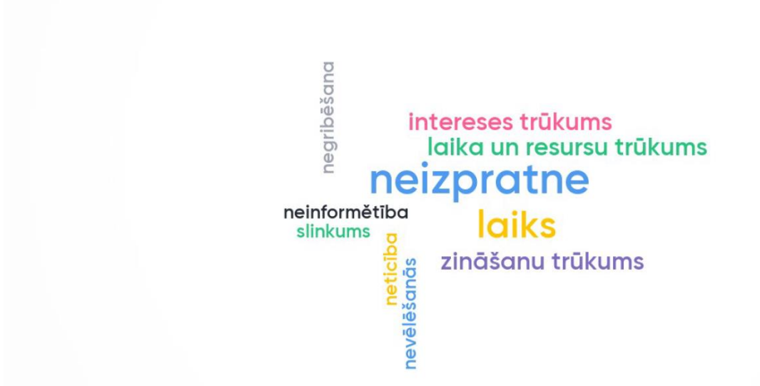
3.att. Vārdu mākonis "Word cloud" darba grupu dalībnieku atbildēm uz jautājumu "Kas traucē iedzīvotāju iesaisti budžeta plānošanā?"