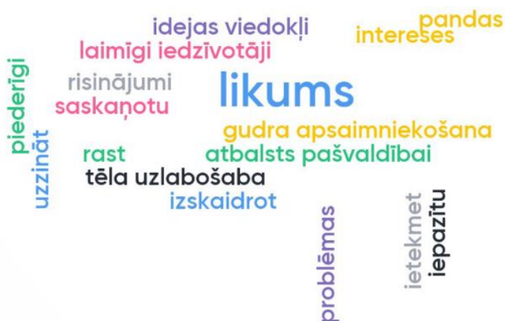
1.att. Vārdu mākonis: darba grupu dalībnieku atbildes uz jautājumu "Kāpēc pašvaldība iesaista iedzīvotājus"?

Izvērtējot saņemtās atbildes, darba grupu dalībnieki ar atzīmi 3,2 no 5 (pieņemtā vērtēšanas skala: no 0 līdz 5; norādītais vērtējums ir vidējā aritmētiska vērtība no visu dalībnieku sniegtajām atbildēm) norādījuši to, ka sabiedrības iesaiste jau šobrīd ir pietiekami svarīga pašvaldības budžeta plānošanā. Ar līdzīgu atzīmi (3,1 no 5) paši dalībnieki norādījuši, ka, izvērtējot savas zināšanas par attiecīgo tēmu, tie ir sabiedrības iesaistes eksperti.