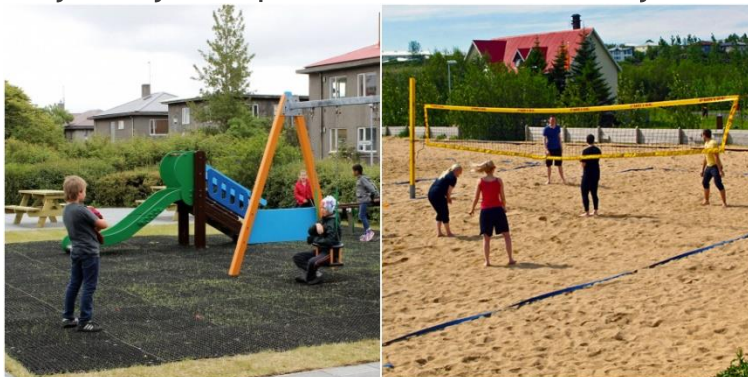
2.att. Reikjavīkā īstenotie projekti – bērnu spēļu laukums un volejbola laukums.

Sešu gadu laikā (2012. - 2017.) Reikjavīkā un tās apkārtnē īstenotas jau 608 iedzīvotāju idejas (sk. 1.att.). Katru gadu pilsēta atvēl 3 miljonus eiro sabiedrības līdzlemtai budžetēšanai. Islandes veiksmes stāsts ir sekmīgas pilsoniskās sabiedrības un pašvaldības sadarbības rezultāts, līdzdarbojoties nevalstiskajai organizācijai 'Citizens Foundation' ("Better Reykjavik" un "My Neighborhood" dibinātāji), Reikjavīkas pašvaldībai un tās iedzīvotājiem.