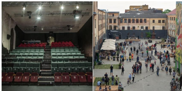
4.att. Sabiedrības līdzlemtas budžetēšanas procesā īstenotie projekti Tartu – Kultūrkvartāls un Aparaditehas parks & dārzs. Attēli izgūti no - www.tartu.ee . - Participatory Budgeting – Winning Ideas.

Sabiedrības līdzlemtas budžetēšanas ieviešanas process Tartu tika veikts ciešā sadarbībā starp Tartu pilsētu, Tartu iedzīvotājiem un nevalstisko organizāciju 'e-Governance Academy' (procesa uzstādīšanas padomnieks). Katru gadu Tartu pilsēta atvēl 200 tūkstošus eiro sabiedrības līdzlemtas budžetēšanas projektiem, iedzīvotājiem izvēloties divas labākās idejas. Kopumā Tartu no jau īstenoti 9 projekti. Sekojot Tartu piemēram, vēl 19 Igaunijas pašvaldības (sk. 3. att.) ir sākušas iesaistīt iedzīvotājus budžeta veidošanā.